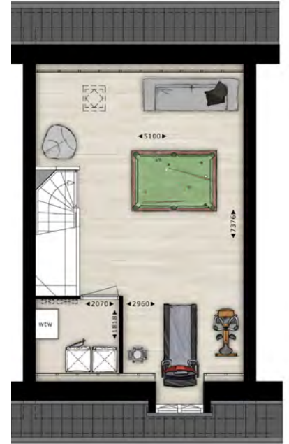
Plattegrond van bnr. 56 en 63.

De begane grond: hal, meterkast, toilet, trapgang naar de eerste verdieping, ruime woonkamer met open keuken en openslaande deuren naar de tuin. De eerste verdieping beschikt over drie slaapkamers en een complete badkamer met Villeroy & Boch sanitair. De zolder bestaat uit een technische ruimte en een open ruimte maar kan optioneel worden ingedeeld in meerdere kamers. Ideaal als u een extra slaap- of hobbykamer wenst.